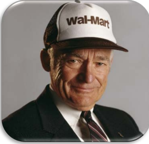
سام والتون، رائد ورجل أعمال أمريكي، عُرف بتأسيسه أكبر سلسلة متاجر بيع بالتجزئة في العالم (Sam Walton)

بالتالي يمكن أن تُوضح خصائص رواد الأعمال كما يلي: [4]